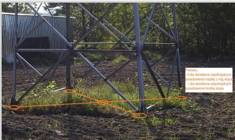
Grafika 1 Przykładowa metodyka określenia współrzędnych posadowienia konstrukcji linii 110 kV, punkty pomiarowe zaznaczono kolorem pomarańczowym